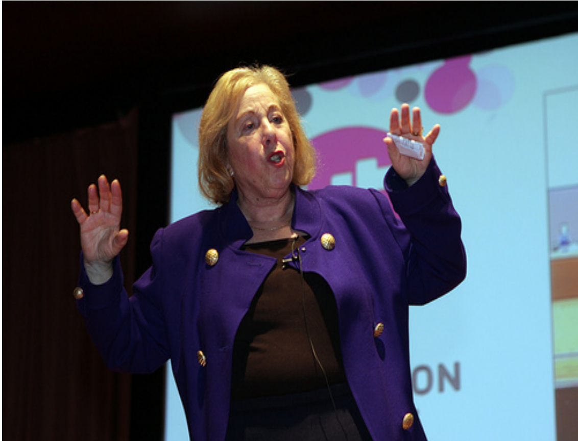
Rosabeth Moss Kanter

Según Rosabeth Moss Kanter 33 (2006) “la vida de todo individuo u organización oscila entre dos estados: triunfo y fracaso. Y así como el triunfo engendra más triunfo, el fracaso engendra más fracaso” .