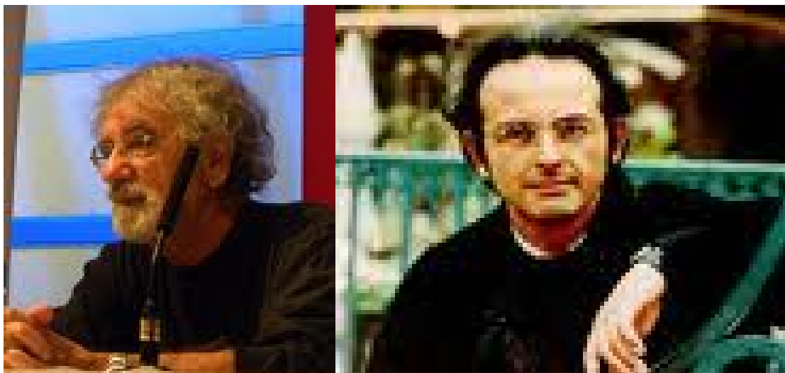
Humberto Maturana Y Francisco Varela http://www.google.com.co/ingres

desarrollos de una autopoiesis social y, para quien los sistemas sociales son autopoieticos, más no sistemas vivos.