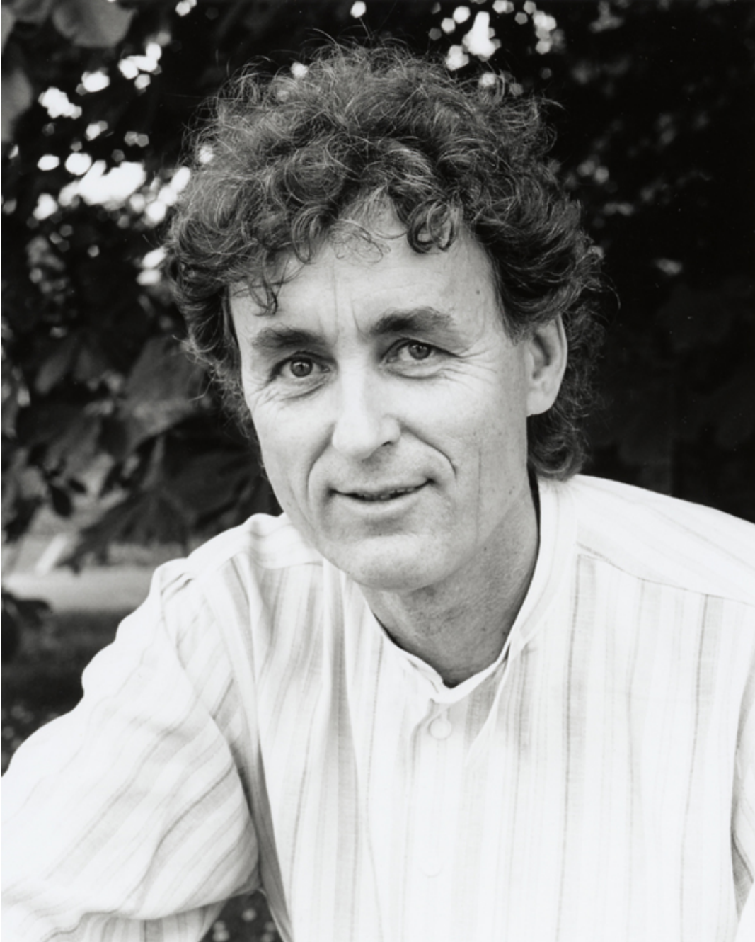
Fritjof Capra Físico Vienes Gestor Del Paradigma Ecológico http://www.fritjofcapra.net/FritjofCapra1.jpg